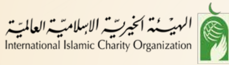
الهيئة الخيرية الإسلامية العالمية International Islamic Charity Organization

إيماناً بأهمية التعاون والشراكة المجتمعية بين السنابل وجميع فئات المجتمع لتحقيق رؤية الجمعية وتقديم أفضل الخدمات للمستفيدين والمتعاونين، أبرمت السنابل العديد من إتفاقيات التعاون والشراكة المجتمعية مع عدداً من الجهات والمؤسسات ليكونوا عوناً للسنابل وشركاءً معها في العطاء، وهم كالتالي: