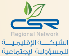
الشبكة الإقليمية للمسؤولية الاجتماعية Regional CSR Network